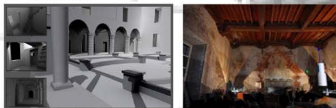
Fig. 2 - Il modello 3D generale interno e esterno dell'edificio realizzato con rilievi integrati strumentali e laser.