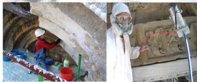
Fig. 2 - Due fasi di pulitura delle superfici lapidee del portale gotico mediante impacchi di solventi e micro sabbatura di precisione con ossidi di alluminio.