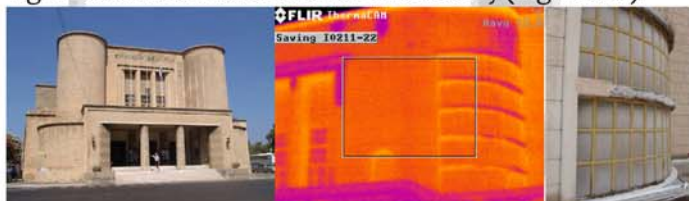
Fig. 3 - Caso studio: Teatro nazionale di Rodi (Grecia).