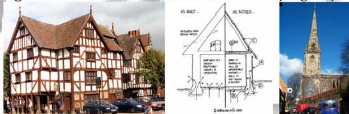
Fig. 2 - Caso studio scala urbana: Shrewsbury (Inghilterra).