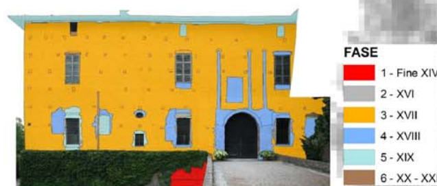
Fig. 1 - Analisi storico archeologica basata sulle stratigrafie murarie con ricostruzione delle fasi storiche del manufatto.