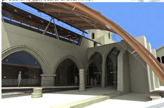
Fig. 3 - Il modello 3D del progetto di rifunzionalizzazione: l'ingresso principale con la nuova copertura a vela.