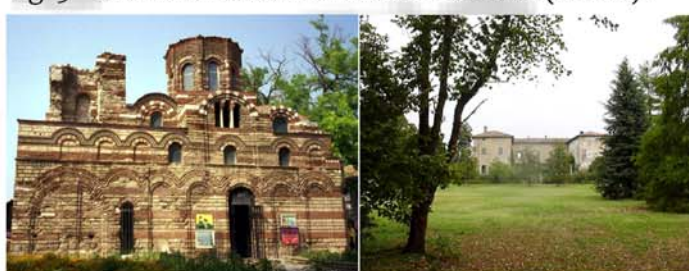
Fig. 4 - Casi studio: Nessebar (Bulgaria) e Zena (Italia).