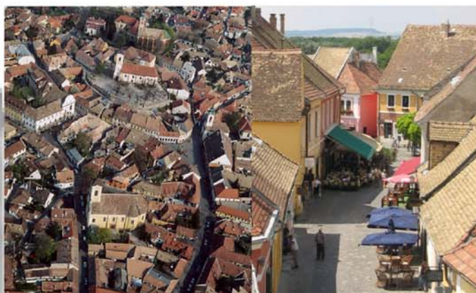
Fig. 1 - Caso studio scala urbana: Szentendre (Ungheria).